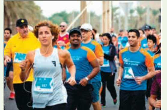
حضور كبير للمساهمة في دعم ذوي الاحتياجات الخاصة