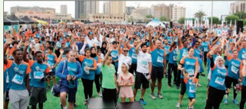
لقطة للمشاركين في سباق العام الماضي

أعلنت مجموعة فوزية السلطان الصحية، المنظمة غير الربحية متعددة التخصصات، عن انطلاق سباق RunKuwait الخيري للسنة الثامنة في 10 نوفمبر المقبل. ويقوم RunKuwait بدعوة جميع أصدقاء السباق والمتسابقين المهتمين بالمشاركة بالتسجيل في السباق للمساهمة والمساعدة في تقديم الرعاية الطبية اللازمة للأطفال ذوي الاحتياجات الخاصة الذي سينطلق من المركز العلمي. ويعد سباق RunKuwait مبادرة خيرية تسعى لتعزيز الوعي وحشد الدعم المادي للمساهمة في تقديم سبل الرعاية للأطفال ذوي الاحتياجات الخاصة. ومنذ عام 2013، عمل السباق على تسخير جميع رسوم التسجيل لدعم مركز تقييم وتأهيل الطفل التخصصي وغير الربحي التابع لمجموعة فوزية السلطان الصحية. ولقد ساهمت في نجاح المشاركات في سباق العام الماضي في تقديم إجمالي 795 جلسة علاج مجانية للأطفال. وتعليقا على السباق، تحدثت المديرية الطبية لدى مجموعة فوزية السلطان الصحية د.إلهام الحمدان، قائلة: «إن تقديم الدعم الطبي للأطفال ذوي الاحتياجات الخاصة هو جوهر كل ما نقوم به، ولأننا نحن نخورون للغاية للإعلان عن عودة سباق RunKuwait للسنة الثامنة على التوالي. وتستمر رحلتنا بفضل الدعم